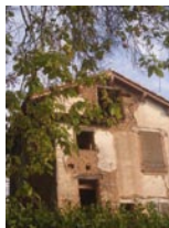
Maison du pêcheur

Le pont de Bioule a été construit en 1859 remplaçant ainsi le bac qui permettait de franchir l'Aveyron et de relier Bioule à Nègrepelisse. En rive droite de l'Aveyron et en amont du pont, une ancienne maison du pêcheur en terre crue témoigne d'un passé de pêche professionnelle sur la rivière.